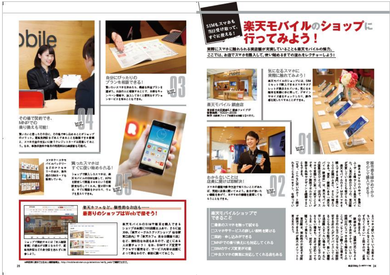
本誌抜粋(楽天モバイルのショップに行ってみよう！)