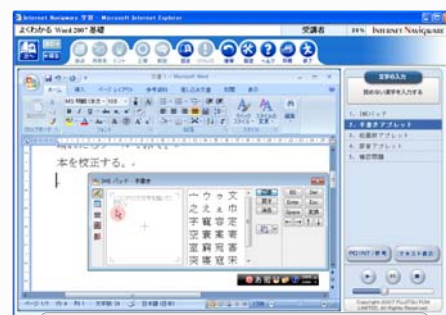
[学習画面] 読めない漢字を入力する