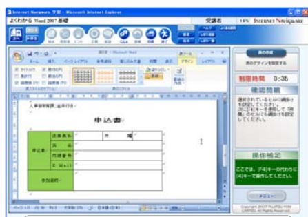
[確認問題画面] 表の挿入