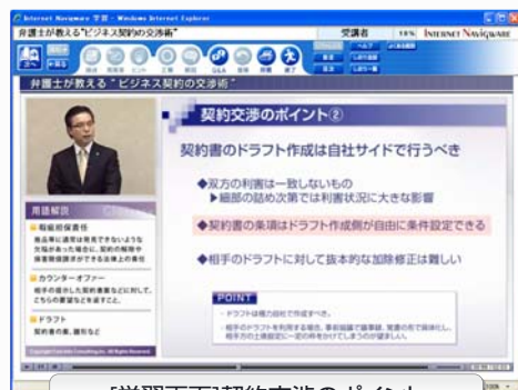
[学習画面] 契約交渉のポイント